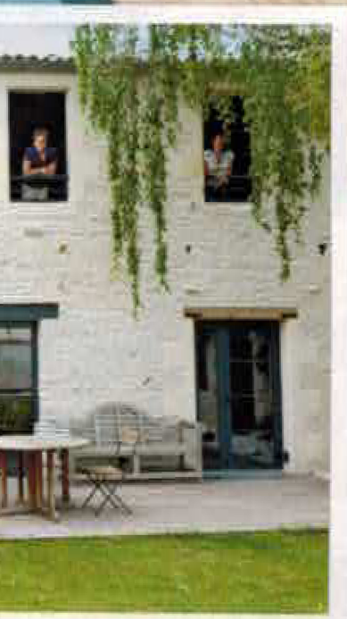
La façade de l'écurie a conservé les niches soutènement où étaient enclenchés, à sa construction, les madriers des échafaudages.

La maison a été baptisée « Un Banc au Soleil » en hommage à l'écrivain Georges Simenon, qui, ayant ainsi intitulé ses mémoires, a séjourné dans le village pendant plusieurs années. Le nom évoque aussi les bancs en bois ou en pierre, faits de linteaux de cheminées récupérés ou d'anciennes mangeoires pour le bétail, qui sont installés dans le jardin.